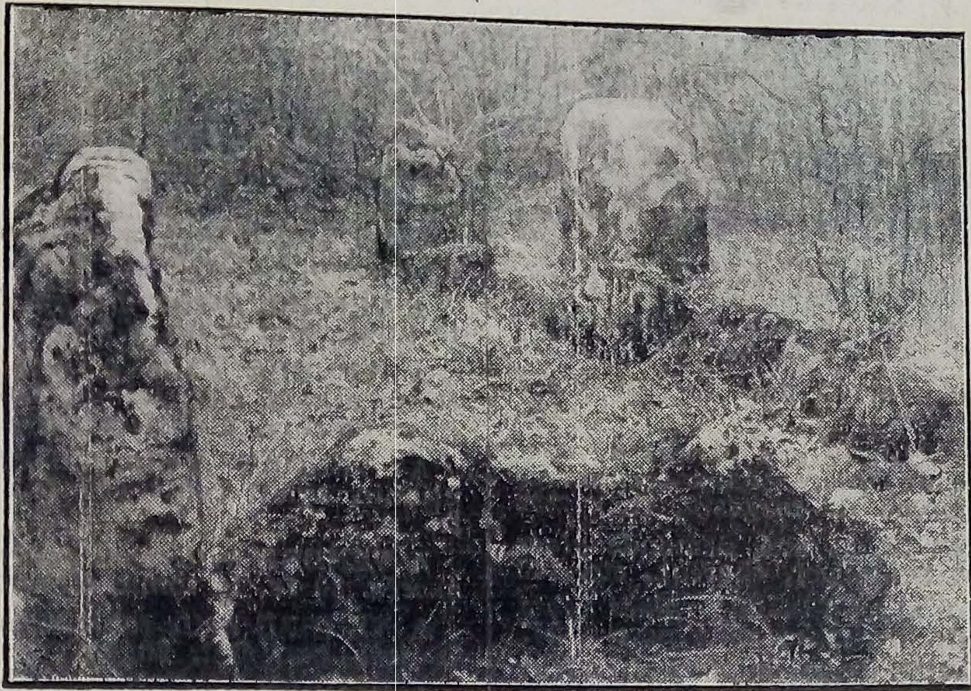
Vue du dolmen de Pierre-la-Treiche