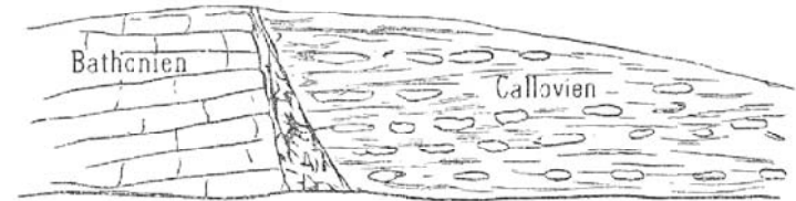
Fig. 3. — Station de Soulosse, Côté oriental de la tranchée; faille située au nord de la gare.

montre une contre-partie; une faille très large, à peu près perpendiculaire à la précédente, abaisse tout le callovien au niveau de la partie moyenne du bathonien supérieur. Qu'on nous par-