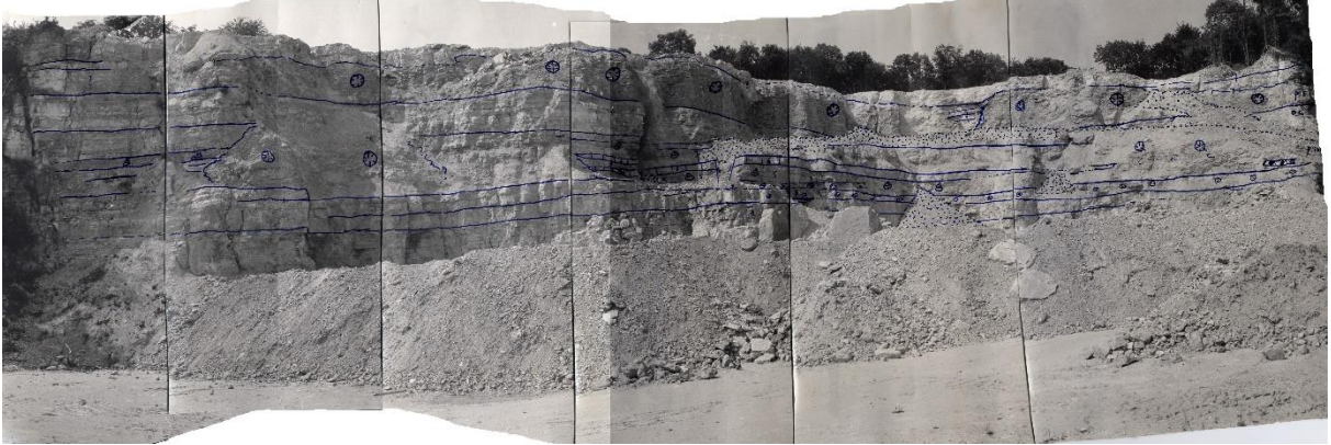
Fig. 2. Panorama interprété de la carrière de Marbache pendant l'été 1984. Vue vers l'Ouest.

6. Calcaire biodétritique, riche en entroques, intraclastes présents. Banc massif terminé par une surface nette, biseauté vers le Sud. Ech MAR 6, épaisseur 0.85m.